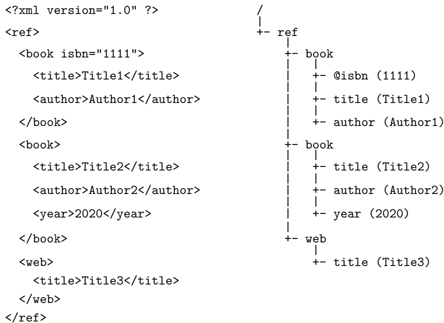
図 1: XSLT における XML 文書のデータモデル (ノード表現)。右側の木において、/ はルートノードであり、@ で始まるノードは属性ノード、その他は要素ノードである。( ) 内は当該ノードの文字列値である。文字列値については後述する。

要素ノード (element node) XML 文書の各要素に対応するノード。XML 文書における「ルート要素」は、データモデルにおいてはルートノードの子である。個々の要素ノードの名前は XML 文書における要素名である。